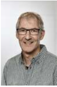
Stefan Zwygart Redaktion Newsletter, Auskunft und Beratung Kontakt