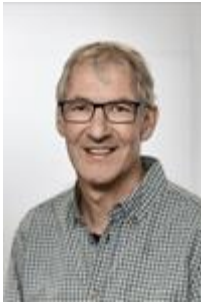
Stefan Zwygart Redaktion Newsletter, Aus- und Weiterbildung Kontakt